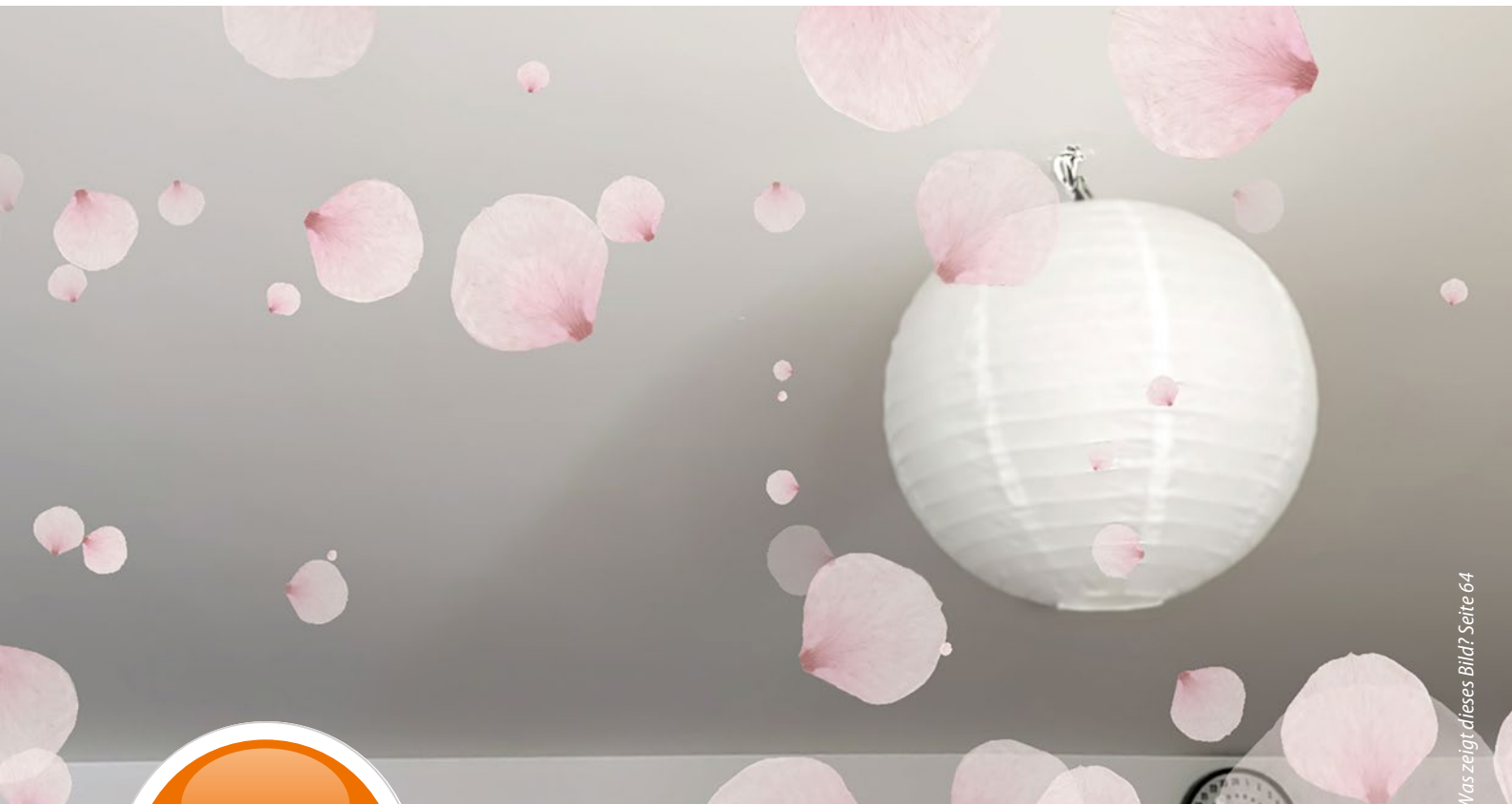
Was zeigt dieses Bild? Seite 64

Offizielles Organ des Berufsverbandes Deutscher Nervenärzte, des Berufsverbandes Deutscher Neurologen und des Berufsverbandes Deutscher Psychiater