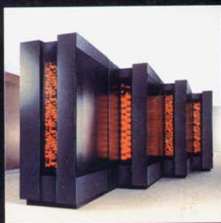
上は最新鋭のコネクションマシン、CM-5。超並列型のスーパーコンピュータでありながら、単なるブラックボックスではない形態を、という同社のデザインポリシーが受け継がれている。右はCM-1、CM-2

The newest super computer, the CM-5 (upper) and the CM-1/CM-2 (right). The CM-5 is the first parallel super-computer to combine scalable hardware and software technology. It incorporates the first supercomputer architecture that scales to a trillion operations per second, and a scalable I/O, communications, memory, and processing.